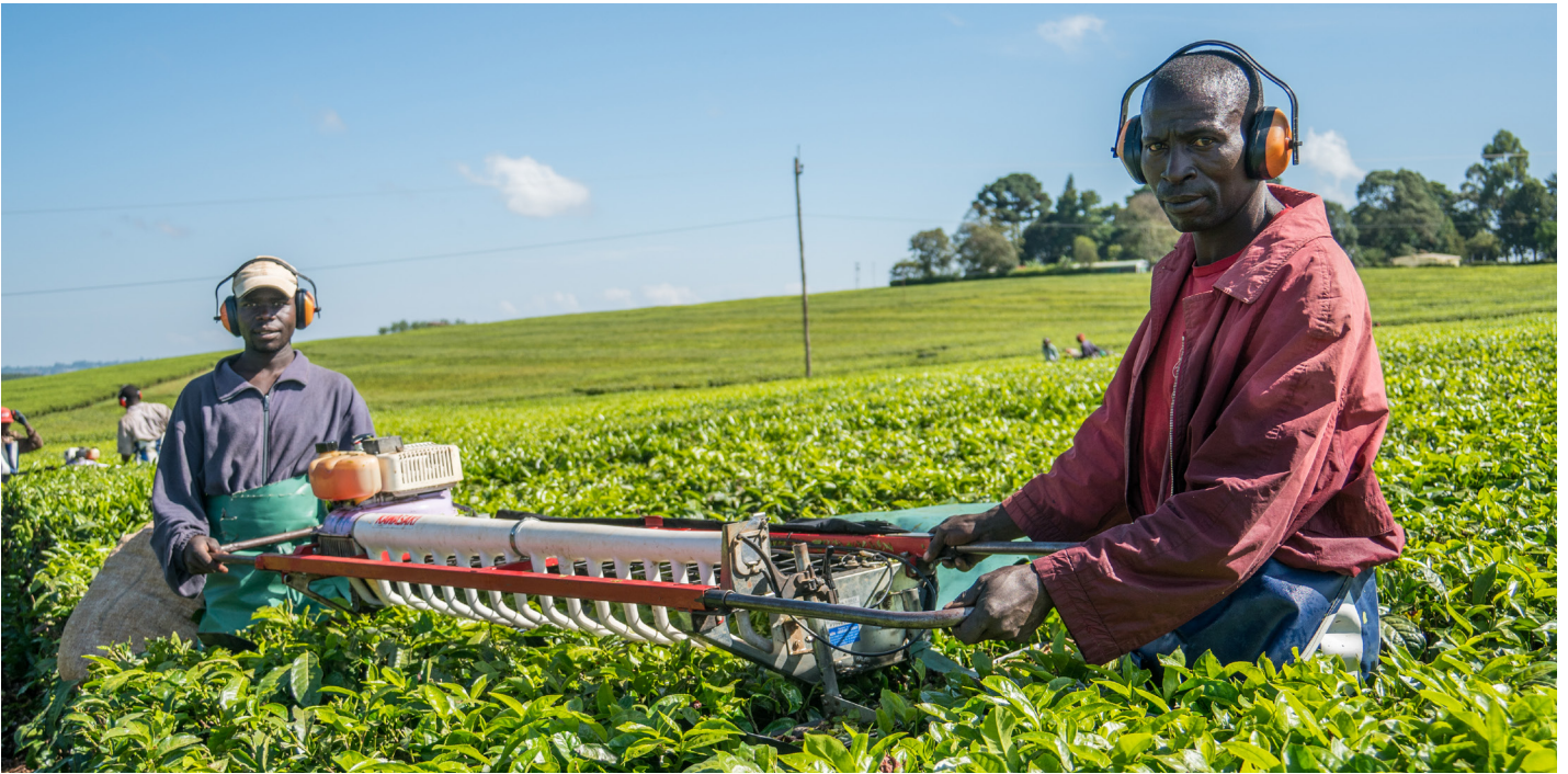
Patrick Sheperd / CIFOR