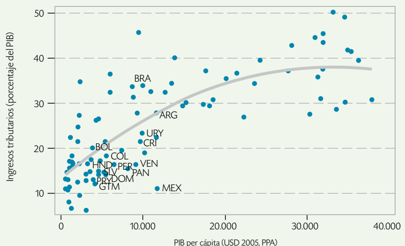
Gráfico 2. Carga tributaria a/ y PIB per cápita para países seleccionados (varios años)

En lugar de comparar la recaudación de cada país con el promedio de aquellos que tienen un nivel de ingreso similar, un enfoque alternativo, que se conoce como el enfoque de frontera, consiste en hacer la comparación con aquellos casos (naciones) que presentan las mejores prácticas o comportamientos en términos de las variables de interés. En particular, la metodología consiste en comparar la recaudación (medida en términos del PIB) de un país determinado con aquellos valores esperados dadas