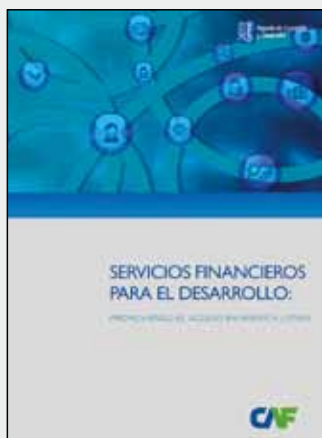
RED 2011 Servicios financieros para el desarrollo