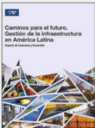
RED 2009 Caminos para el futuro