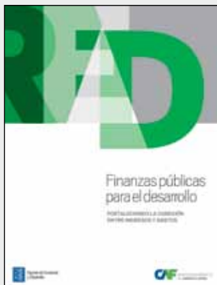
RED 2012 Finanzas públicas para el desarrollo: Fortaleciendo la conexión entre ingresos y gastos

Desde el año 2005, CAF publica anualmente su Reporte de Economía y Desarrollo, RED. Esta publicación, elaborada por profesionales de la Dirección de Investigaciones Socioeconómicas bajo la asesoría de destacados académicos y personalidades de la región, busca contribuir al creciente debate sobre las estrategias de desarrollo de América Latina y orientar el diseño y la implementación de políticas públicas.