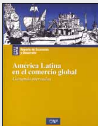
RED 2005 América Latina en el comercio global