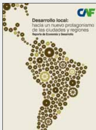
RED 2010 Desarrollo local