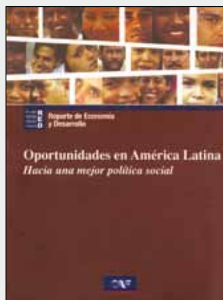
RED 2007-08 Oportunidades en América Latina