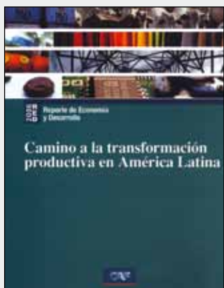
RED 2006 Camino a la transformación productiva en América Latina